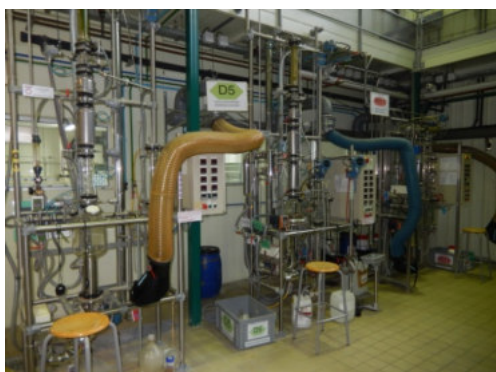
Hall des opérations unitaires

Demandez à participer à cette consultation par simple mel à Olivier Chedeville olivier.chedeville@univ-orleans.fr ou Myriam Rouet-Meunier uic.centre@wanadoo.fr