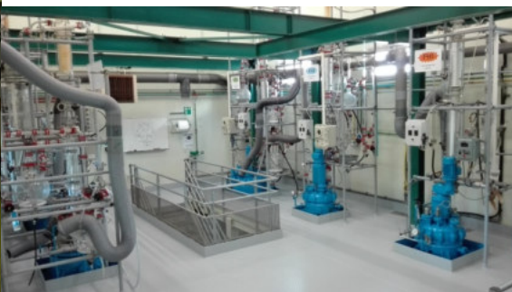
Hall des réacteurs chimiques