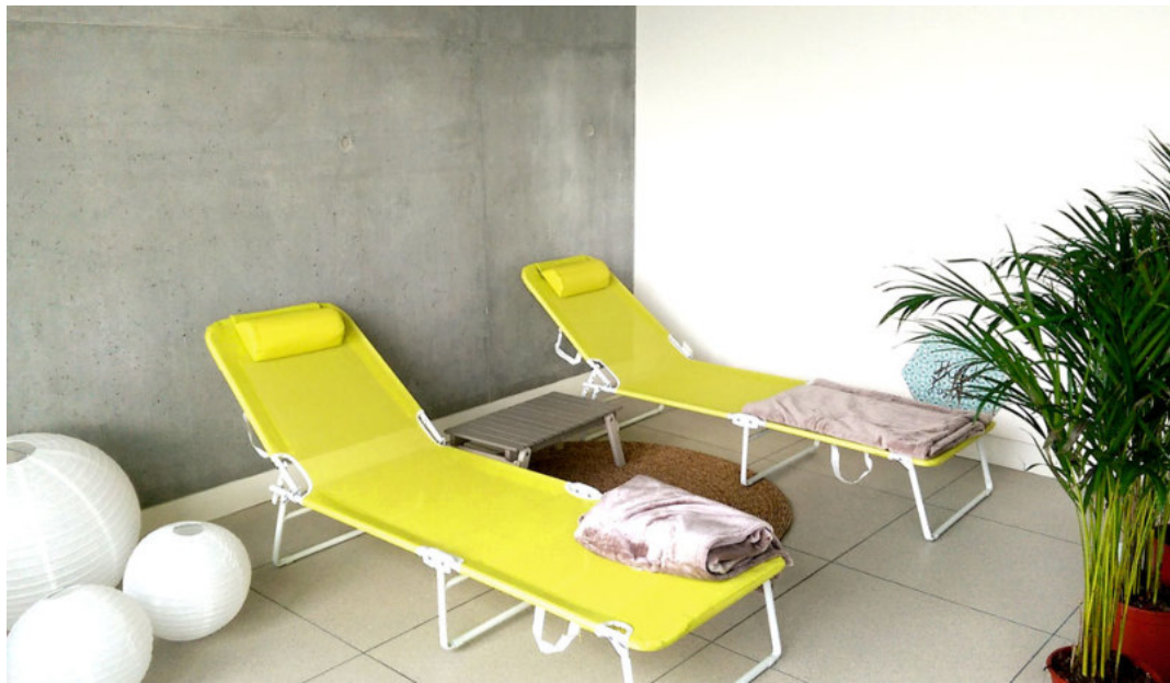
Notre salle de sieste