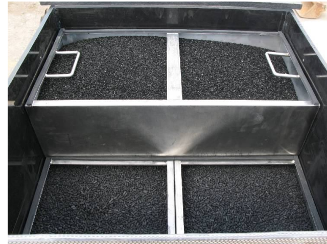
2 étages de charbon actif, sélectionnés pour le cocktail de COV caractérisé